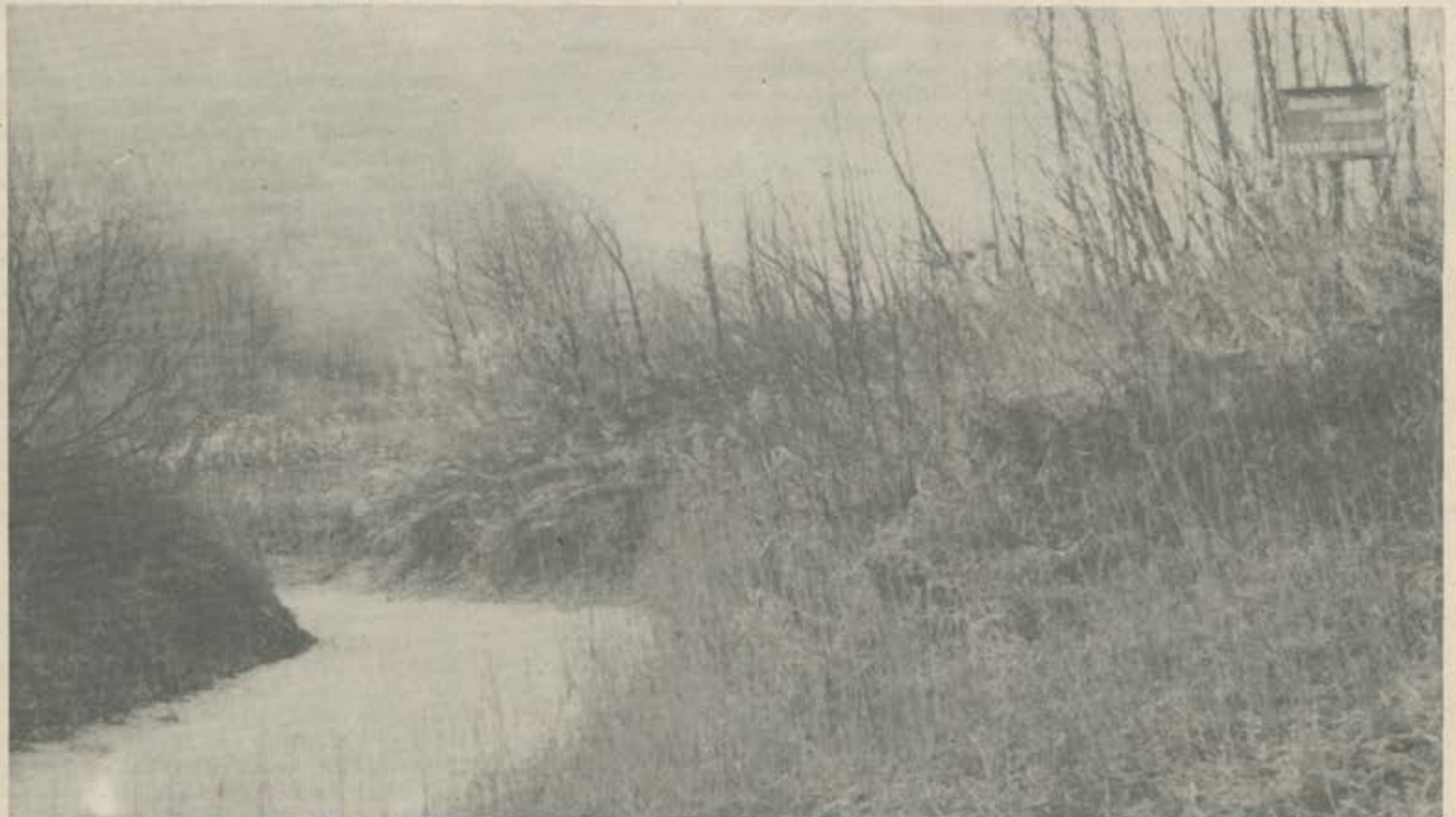
Gelände des Nörsacher Tümpels; Text auf der Tafel: „Biologisches Schutzgebiet, Feuchtbiotop, Bitte nicht betreten!“

Schwimmkäfer (Dytiscidae): Guignotus pusillus , Agabus congener , A. paludosus , A. sturmi , Platambus maculatus , Ilybius ater , Hydroporus discretus , H. erythrocephalus (1960 bis 1963 in alten Tümpeln), H. marginatus (18. 4. 70), H. palustris (häufigste Art der Gattung) u. a. recht regelmäßig anzutreffen auch der größte einheimische Schwimmkäfer: Gelbrand ( Dytiscus marginalis ), dessen Larve