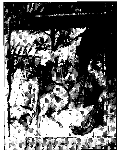
3 Fastentuch; wie Bild 1; signiert: »HAM, 1640«