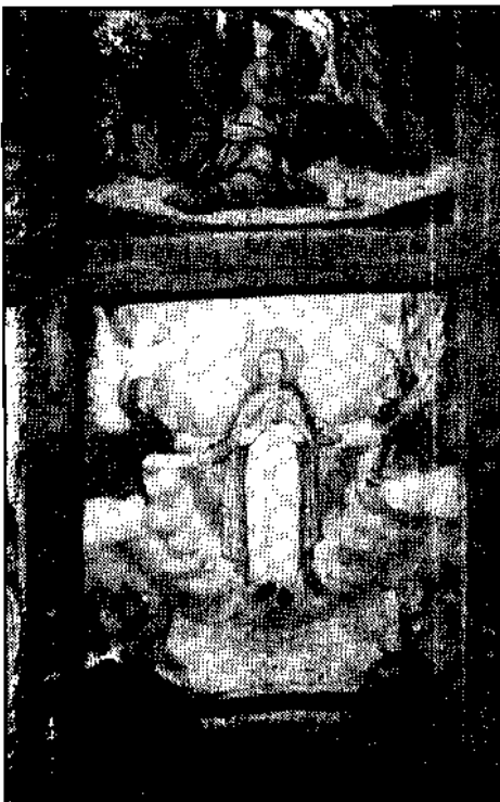
1 »Maria Himmelfahrt« im Wiener Volkskunde-Museum, 1640

Ein größeres Fastentuch aber ist in Osttirol bisher nur in dem von Obermauern b. Virgen, gemalt von Stefan Flaschberger »1598«, erhalten geblieben. Diesen durchwegs kleinformatigen, aber figurenreichen got. Bildteppichen wäre auch unser obge-