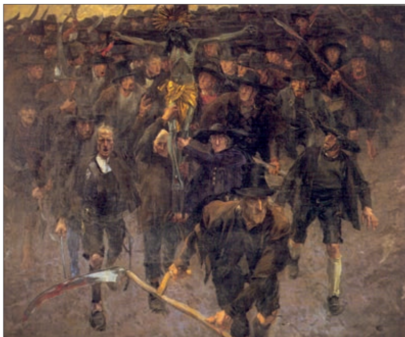
Albin Egger-Lienz, Das Kreuz, Öl auf Leinwand, 1898/1901, dessen Bildinhalt sich auf die erfolgreiche Verteidigung der Lienzer Klause am 8. August 1809 bezieht. (TLMF, Gem 1189)

Diese Begebenheit an der Lienzer Klause hat Albin Egger-Lienz im großartigen Historienbild „Das Kreuz“ (1898/1901) wiedergegeben. Es zeigt Hauger mit dem Kreuz und dahinter lawinenartig die Masse der herbeigeströmten Landesverteidiger. 16