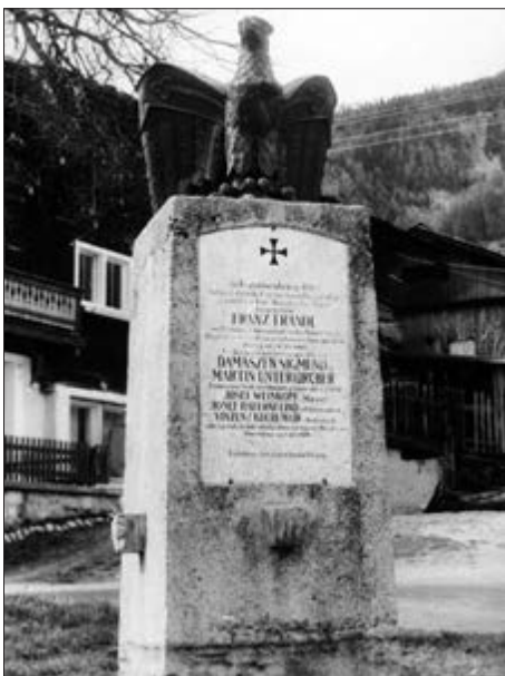
Denkmal auf dem Kirchplatz in Virgen zur Erinnerung an die einheimischen Opfer des Tiroler Freiheitskampfs 1809: Franz Frandl, Johann Damaszen Sigmund, Martin Unterkircher, Josef Weiskopf, Josef Bauernfeind, Vinzenz Kuchlmair; Aufnahme um 1975. Foto: M. Pizzinini

Wenn nicht anders angegeben, wurden die Aufnahmen vom Tiroler Landesmuseum Ferdinandeum angefertigt.