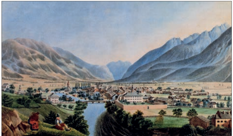
Lienz gegen Osten, Aquarell, um 1800 (Museum der Stadt Lienz, Schloss Bruck).