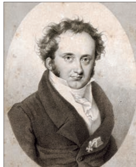
Joseph Freiherr von Hormayr, 1809 in Tirol als kaiserlicher Intendant zur Wiedereinrichtung der österreichischen Verwaltung eingesetzt, zeitgenössische Radierung.

„Glücklich erreichten wir das Grenzstädtchen Lienz, wo wir einige Linientruppen trafen, und vor jeder weiteren Mißhandlung sicher waren. Hier schickten wir den bewaffneten Bürger, der uns auf unsere Kosten bis Klagenfurt hätte begleiten sollen, zu seinen Spießgesellen nach Innsbruck zurück, und machten ihm begreiflich, daß wir in Kärnthen, so wie in jedem Lande, wo keine Banditen sind, durchaus keine Sicherheitswache nöthig hätten. Dieser Philister, der uns begleitete, hatte vor 8 Tagen zu Innsbruck einige Pferde, Waffen, und Geld von den Dragonern unseres Königes, die er mitmorden half, erbeutet, und war jetzt unsere Sicherheitswache! Er hatte die Unverschämtheit uns einige Mahle zu zeigen, daß seine Flinte scharf geladen sey; und wir bemerkten dagegen nur, daß unsere Reisemesser sehr scharf geschliffen sind, so daß man allenfalls eine Feder damit schneiden könnte.