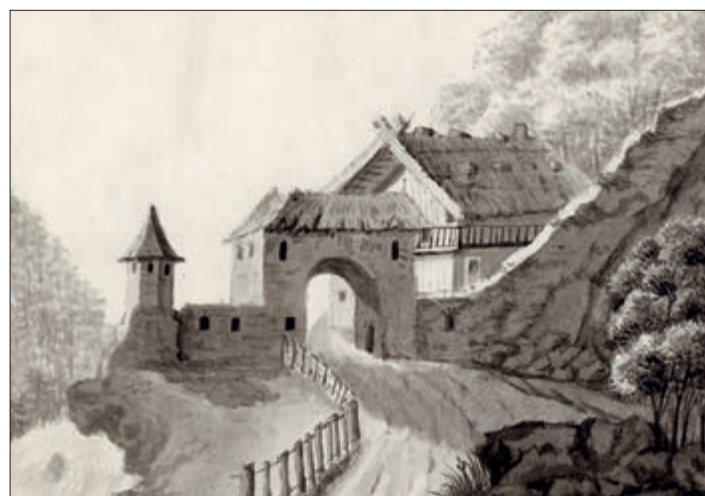
Die Lienzer Klause auf der nordseitigen Anhöhe am Eingang ins Pustertal und die Befestigung an der Talstraße, aquarellierte Federzeichnung von Caspar von Pfandler, 1799 (TLMF, W 11.162) bzw. Aquarell von J. A. Cornet, 1835. (TLMF, W 9296)