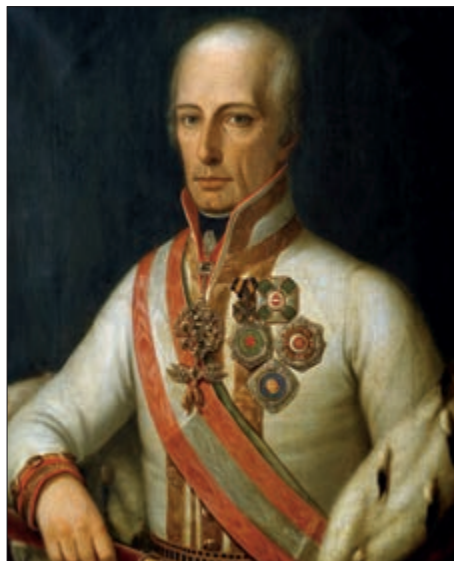
Österreichischer Maler, Kaiser Franz I. von Österreich, Öl auf Leinwand, um 1810. (TLMF, Gem 1987)

„Bey unserer Ankunft in Sillian peinigte uns der Postmeister mit Erzählungen ungeheurer Siege des Erzherzogs Johann, die wir anhören, und was noch ärger war, die wir zu glauben scheinen mussten. Diese Marter war indessen geringer als jene,