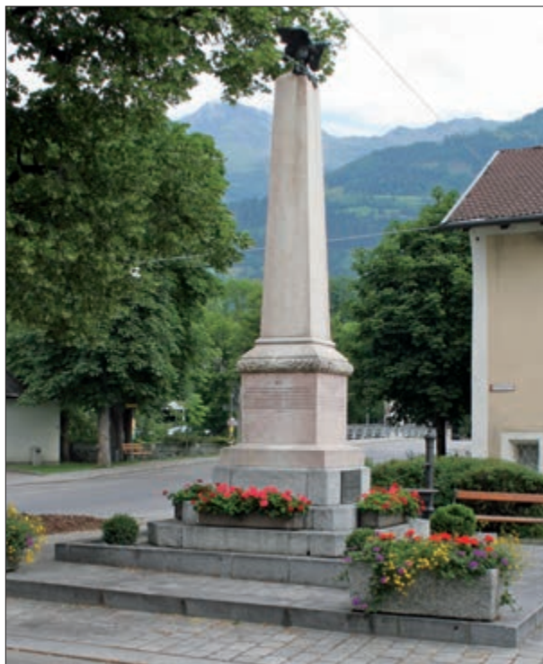
Denkmal für den Einsatz und die Opfer der Tiroler Landesverteidigung in den Jahren 1809 und 1813. Das Denkmal am Platz vor dem Lienzener Dominikanerkloster wurde 1910 enthüllt.

Nachdem sich Österreich unter Kaiser Franz I. im Sommer 1808 zu einem neuerlichen Kriegszug gegen Frankreich bzw.