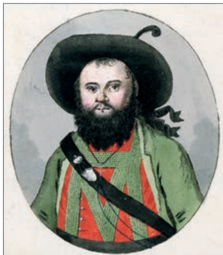
Andreas Hofer als Oberkommandant der Landesverteidigung im Südlichen Tirol, Radierung, zeitgenössisch koloriert.

Am 29. Mai, am Tag der zweiten Bergisel-Schlacht, verließ der zunächst als „Haudegen“ und „Kriegsheld“ gefeierte