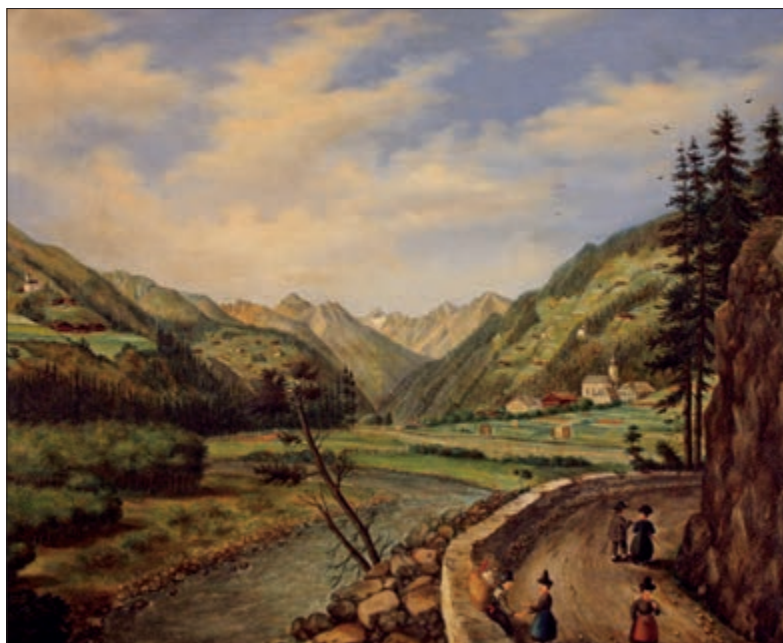
Franz Stemberger, Blick auf Ainet, im Vordergrund die Engstelle zwischen dem Aineter-Bergl und der damals noch nicht regulierten Isel, Öl auf Leinwand, 1865 (Museum der Stadt Lienz Schloss Bruck).

Im Prinzip war keine der beiden Seiten berechtigt, den „Friedensvertrag“ zu unterzeichnen. Der Franzose Gougeon tat dies wohl, um leichter und ohne Schwierigkeiten in die Iselregion zur Entwaffnung der Bauern einrücken zu können. Die Einheimischen vertraten vermutlich die Ansicht, ihrem Heimatland einen angemessenen Platz im Kaisertum Napoleons erkämpft zu haben, verbunden mit dem Rückerhalt ihrer alten Rechte und der freien Ausübung ihrer Lebensgewohnheiten, besonders auch auf religiösem Gebiet.