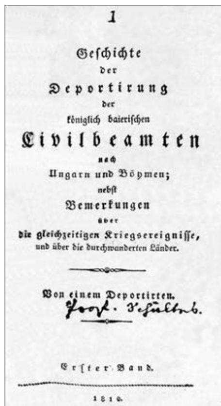
Titelseite des ersten Bandes mit dem Bericht über die Deportierung bayerischer, hoher Persönlichkeiten von Innsbruck nach Klagenfurt im April 1809. (TLMF, Dip. 143)

Endlich gelangte man nach Lienz, das in der Beschreibung der „Deportirten“ nicht ganz schlecht abschneidet: